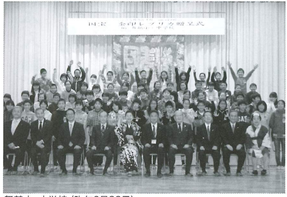
舞鶴小・中学校 (昨年2月23日)