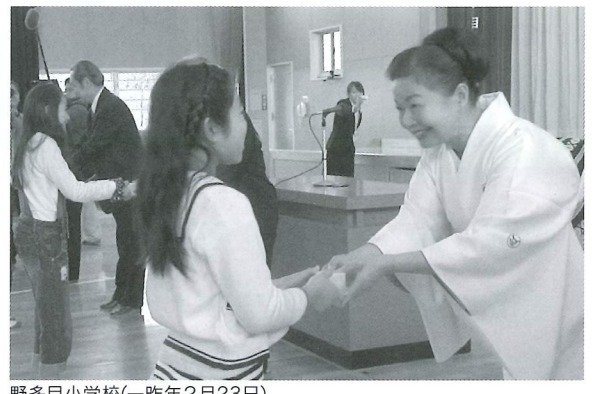
野多目小学校(一昨年2月23日)

※小さな博物館運動にご協力をお願い致します。口座名 NPO法人 金印倶楽部 福岡銀行 天神町支店 普通 2539196 西日本シティ銀行 天神支店 普通 3090842