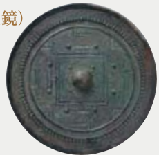
銅鏡（方格規矩鏡） 【どうきょう（ほうかくききょう）】

面径27.1cmに及ぶ超大型鏡で中央に方形の区画（方格）を置き、そのまわりにT・L・V形の模様を巡らしています。大和朝廷の国家祭祀に欠かせないものでした。