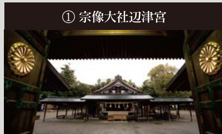
① 宗像大社辺津宮 露天祭祀の面影が残る高宮祭場と三つの主要なお宮がある総社

沖ノ島は日本と大陸における交流の航路上、道標となる島で信仰の対象となっていました。宗像では沖ノ島ゆかりの地が今も当時の風景を残しています。