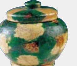
奈良三彩小壺 【ならさんさいこつぼ】

唐三彩の技術をもとに日本で最初に作られた多彩釉陶器です。大和朝廷が技術を独占し、必要に応じて製作したとみられており、朝廷が沖ノ島祭祀を重要視した様子がうかがえます。