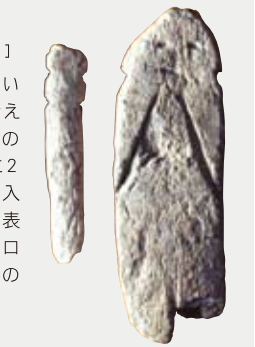
滑石製人形 【かっせきせいひとがた】

人形は最も重い意味を持つと考えられている供物の一つです。両側に2箇所ずつ刻みを入れ、頭・胴・足を表し、中には目・鼻・口まで表現したものもあります。