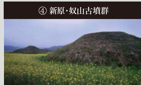
④ 新原・奴山古墳群 国道495号線沿いの古墳群には沖ノ島祭祀を担った豪族が眠る

宗像大社の三宮の一つに数えられ、宗像三女神の次女神・満津姫神（たぎつひめのかみ）が祀られています。大島で最も高い山・御嶽山（みたけさん）東麓に鎮まり、辺津宮と向き合うように建てられています。