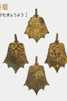
金銅製棘葉形杏葉 【こんどうせい きょくようがたぎょうよう】

沖ノ島からは銅に渡金を施した馬具類も多数発見されており、杏の葉の形状で、先端部分が棘状になっているため、棘葉形杏葉といえます。唐草文の優美な意匠が施されています。