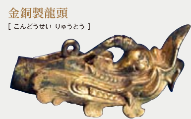
金銅製龍頭 【こんどうせい りゅうとう】

龍の頭をかたどった金具。敦煌の莫高窟の壁画に用途が描かれており、竿先につけて口元から幡などをつり下げる金具とみられています。