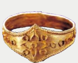
金製指輪 【きんせいゆびわ】

内径は1.8cm。純金のため、1500年の歳月を経ても色褪せることなく、当時の輝きを今に伝えています。側面の円文には赤や緑の宝石が入っていた可能性もあります。