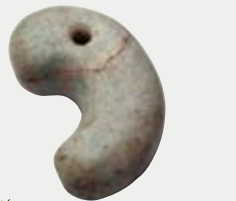
勾玉（硬玉） 【まがたま（こうぎよく）】

勾玉は硬玉、碧玉、水晶、滑石をはじめ、大小様々な形状のものが各時代を通じて奉獻されました。古い時代のものは石質もよく美しく、硬玉（ヒスイ）は白地の石にエメラルドグリーンが神秘的な雰囲気気を漂わせています。