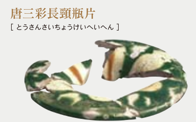
唐三彩長頸瓶片 【とうさんさいちやうけいへいへん】

白色の素地の上に緑、白、褐色の釉薬が施された唐時代の陶器です。本品は長頸瓶の口縁と側面の装飾（メダイヨン）の破片です。（写真は口縁部）