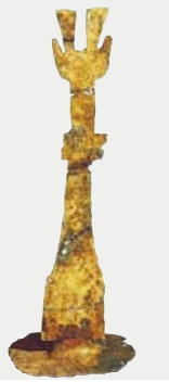
金銅製雛形紡織具（櫛） 【こんどうせい ひながたぼうしよく（たたり）】

櫛という糸掛けの用具をかたどった金銅製のミニチュア。櫛をはじめとする紡織具のミニチュアは、伊勢内宮の『皇大神宮儀式帳』（9世紀成立）記載の神宝や、現在の同宮の神宝と内容が共通する。