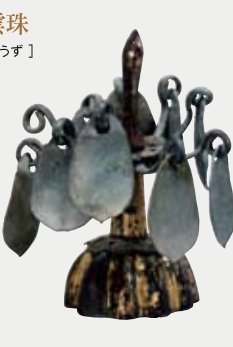
金銅製歩揺付雲珠 【こんどうせい ほようつきうず】

馬の尻部を飾る装飾品で、枝状のつり手の先端に「歩揺」が下げられています。金銅製で奉獻された当時は、歩揺がひらりと揺れ、眩しく光を放ったことでしょう。