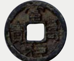
富寿神宝 【ふじゅしんぼう】

中国の貨幣制度にならい、大和朝廷が発行した銅銭の一つです。818年から製造された貨幣であることから、露天祭祀が九世紀まで行われていたことが判明しました。