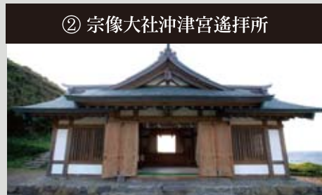
② 宗像大社沖津宮遙拝所 神宿る島を彼方に望む沖ノ島信仰の重要拠点

宗像三女神の末女神・市杵島姫神（いちきしまひめのかみ）を主祭神とする宗像大社辺津宮（へつぐう）には、本殿を中心に高宮祭場、第二宮、第三宮、神宝館、祈願殿などが点在しています。