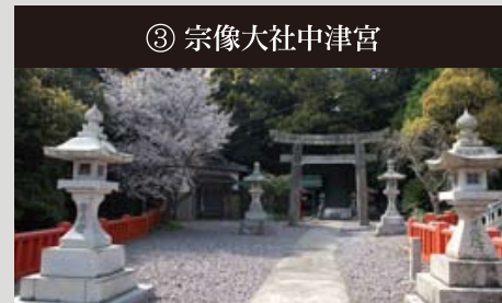
③ 宗像大社中津宮 御嶽山の東麓に建てられた辺津宮と向き合うお宮

島そのものがご神体で、厳格な禁忌により通常渡島が制限されている沖ノ島を拝す（遙拝）場所としてできたお宮。当時は沖ノ島に向かった父や夫の無事を遙かに女性たちが祈っていました。