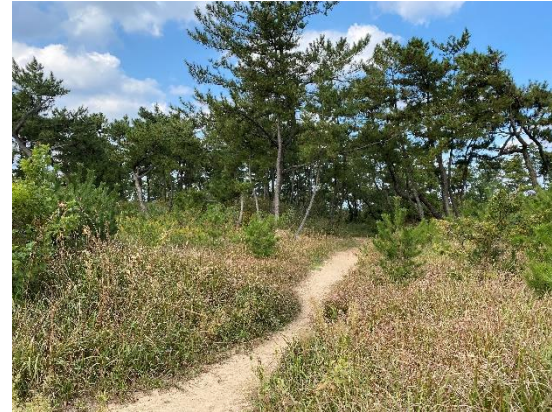
駐車場から海岸へのルート