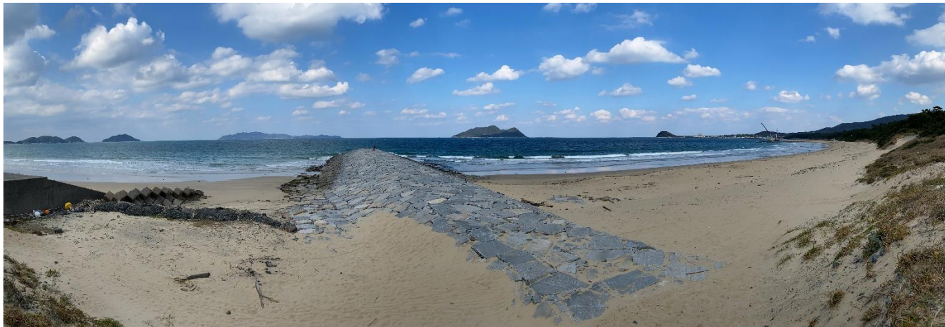
対象地（さつき松原海岸②）