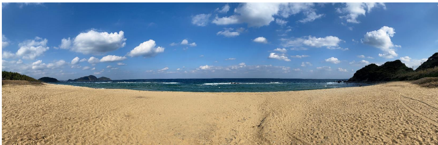
対象地（深浜海水浴場）